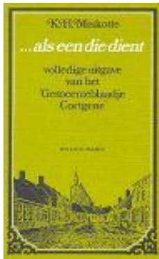
Afb. 3: omslag uitgave (1977)

Miskotte begon in de herfst van 1923, toen hij twee jaar in dienst was van de Nederlands Hervormde gemeente in Kortgene, voor zijn gemeenteleden een kerkblaadje samen te stellen dat later volledig (1923-1925) is uitgegeven onder de aan Lukas 22:26 ontleende titel ... als een die dient . 40 Ideeën daarover vertrouwde hij al in mei aan zijn dagboek toe. 41 Men moest apart op het blaadje intekenen en er een bescheiden bedrag voor betalen. Bij de oprichting kostte het blad f 0,25 per drie maanden (dit zou omgerekend nu € 3,99 voor drie maanden zijn). 42 De uitgave werd extern gedrukt en verscheen al na korte tijd wekelijks. Naast mededelingen en lijstjes met aanbevolen Bijbelteksten, werden er overdenkingen en losse gedichten in opgenomen. Met de dagelijkse Bijbelteksten