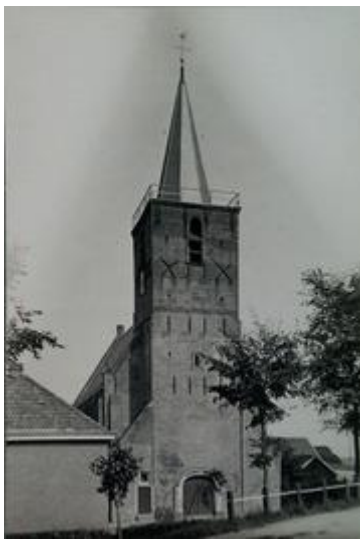
Afb. 2: kerk in Kortgene (ca. 1925) met links de gemeenteschool

Kortgene is een stadje op het Zeeuwse Noord-Beveland. De kerk waaraan Miskotte was verbonden, dateert van origine uit de 15 e eeuw, maar alleen de toren overleefde een brand en diverse stormvloed. In 1684 werd het gebouw hersteld en in 1754 gerestaureerd. 19