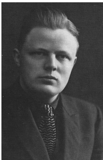
Afb. 1: K. H. Miskotte (1925)

Het werk van Miskotte valt te onderscheiden in: het theologische, filosofische en het de literatuur betreffende werk. In deze paragraaf zal ik hierop ingaan, voor zover het van belang is voor het begrijpen van de taak die hij zichzelf als cultuurbemiddelaar stelde.